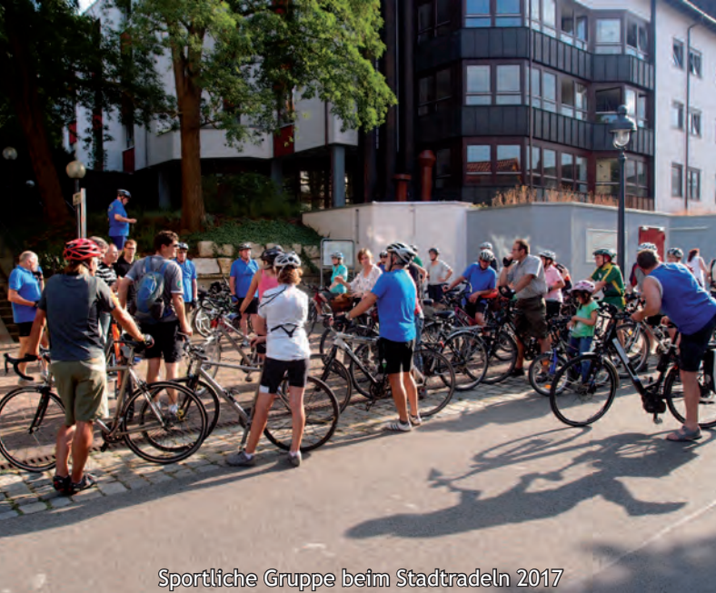
Sportliche Gruppe beim Stadtradeln 2017