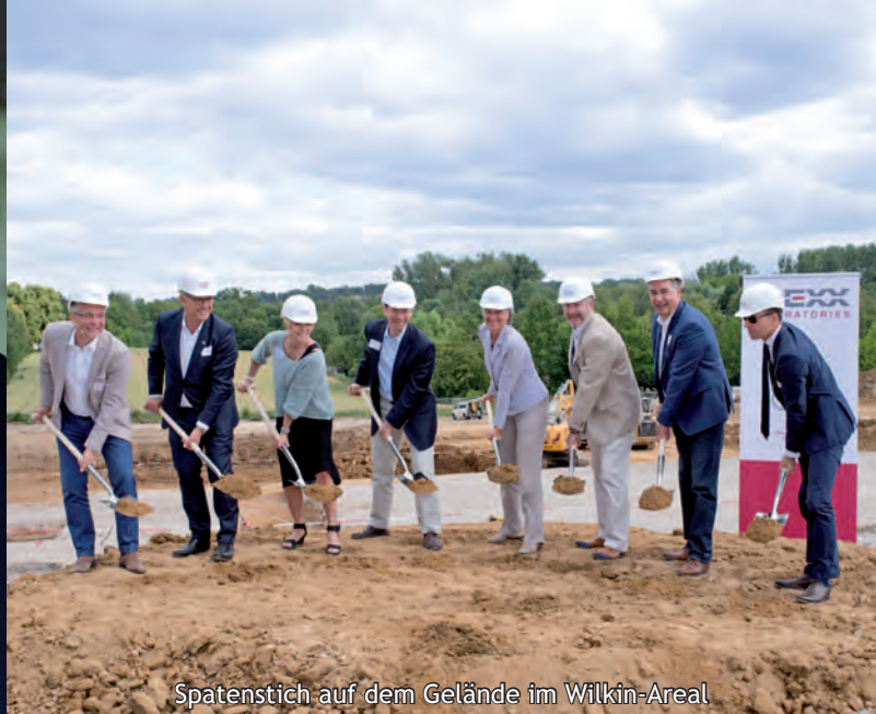
Spatenstich auf dem Gelände im Wilkin-Areal